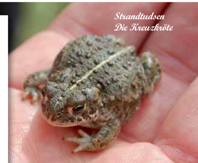
Strandtudsen Die Kreuzkröte